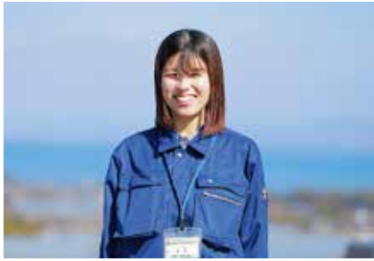
【入庁年】令和5年度 島原振興局建設部道路第二課幹線道路第一班