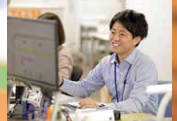
福祉施策の推進に向けて業務に取り組む様子