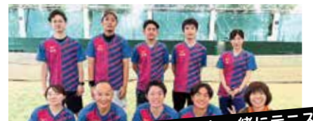
職場の仲間と一緒にテニス!

毎週、職場の方たちとテニスをしています。オフの時間に自分の好きなことをしてリフレッシュしています。