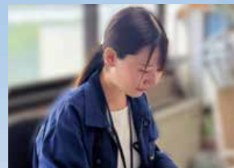
建築基準法に基づく図面審査を行い、 安全・安心な暮らしを守ります。