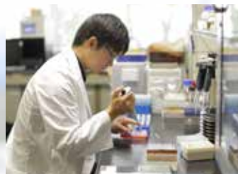
土壌病原菌の遺伝子検査