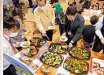
長崎県庁で実施した「ながさき健味ん(けんみん)弁当」キャンペーンPRイベントの様子

福祉保健部は、医療・介護需要の増加への対応、健康づくり、障害者の自立支援、地域で支え合う福祉の推進、出産や子育てがしやすい環境づくり、子ども・子育て家庭への支援について、市町、企業、NPO法人や県民と協働して総合的・体系的に進め、「県民一人ひとりの尊厳が保たれ、住み慣れた地域で安心して暮らし続けることができる持続可能な地域共生社会の実現」を目指しています。