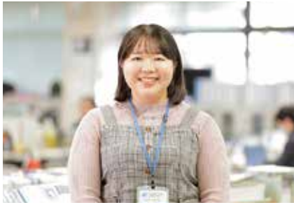
【入庁年】令和5年度 県央振興局保健部地域保健課保健福祉班