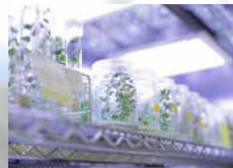
新品種育成のための育種素材