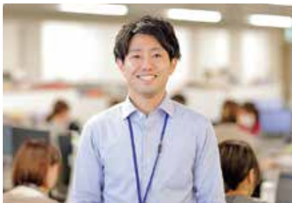
【入庁年】平成29年度 子ども政策局子ども家庭課