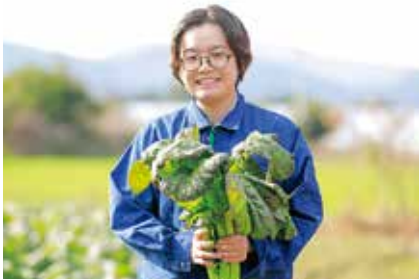
【入庁年】令和4年度 五島振興局農林水産部農業振興普及課

映画が大好きなので業務終了後はレイトショーを観に行きます。休日は友人とグランピングやバーベキューをして楽しんでいます。長崎和牛は外せません！