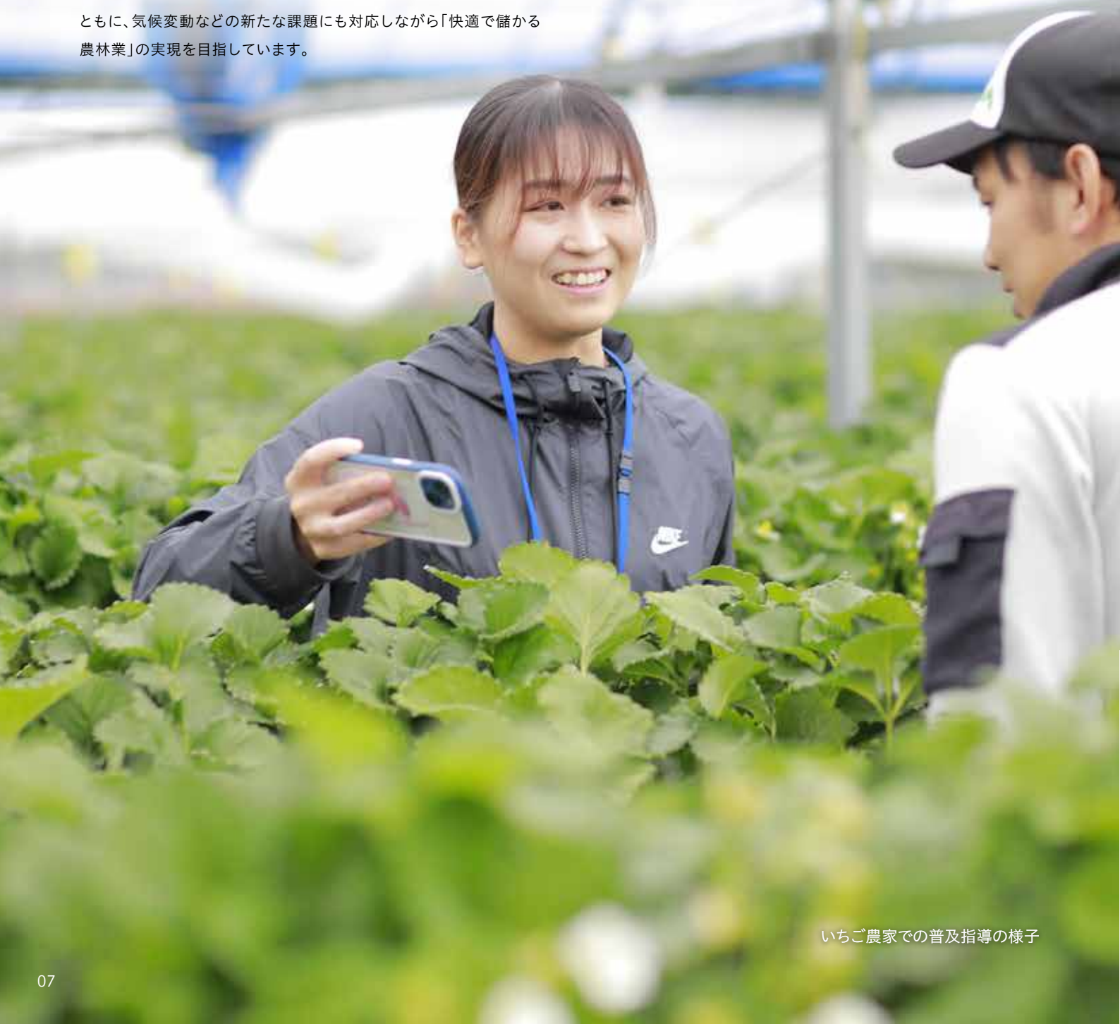
いちご農家での普及指導の様子