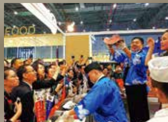
中国での商談会の様子

水産部は、生産量・産出額ともに全国上位の規模を誇る本県水産業のさらなる発展のため、漁業（沿岸、沖合）や養殖業における収益性の高い経営体の育成や水産物の国内・国外への販売促進による漁業者所得の向上、水産業の担い手の育成・確保、漁港・漁場などの生産基盤の整備、「スマート水産技術」の活用による生産性向上、新技術開発のための調査研究など、漁協や市町などの関係機関と連携してさまざまな施策を展開しています。