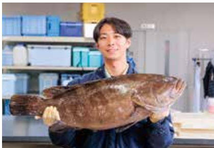
【入庁年】令和4年度 総合水産試験場漁業資源部栽培漁業科

息子と公園に行きます。息子が遊んでいるのを見ていたりリフレッシュできて、オンとオフの切り替えにも効果的だと思っています。