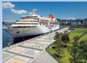
2パース化を進めている 長崎港松が枝国際ターミナル

また、若者世代や子育て世代などの快適な住まいづくりの支援や長崎らしい魅力ある景観の創出、長崎ならではの地域間交流の拠点となる港湾の整備など、ハード面による魅力ある長崎県づくりを推進しています。