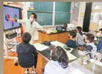
小学生を対象にした水産教室の様子