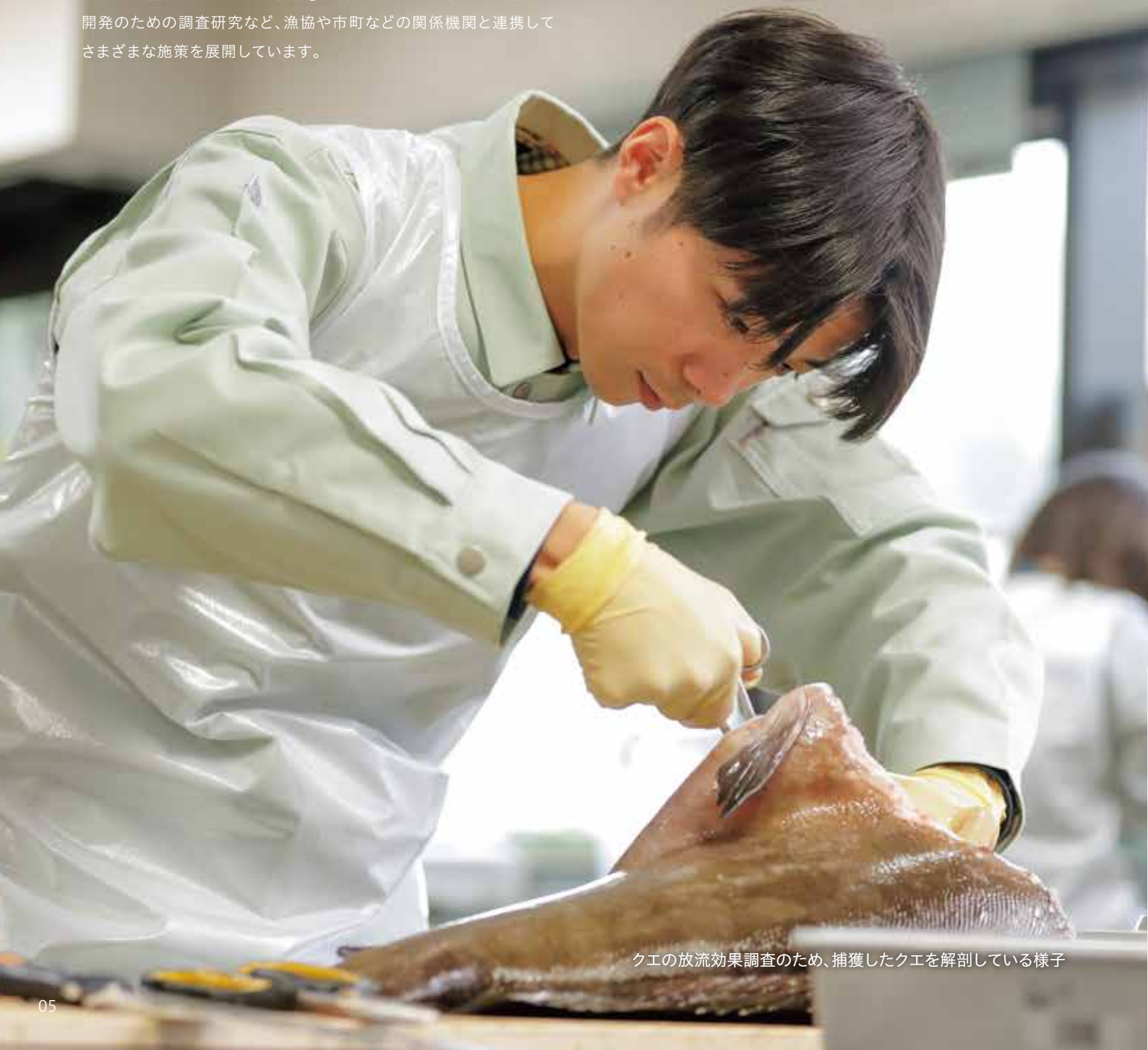
クエの放流効果調査のため、捕獲したクエを解剖している様子