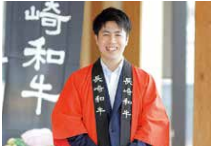
【入庁年】令和5年度 農林部農産加工流通課企画・輸出振興班