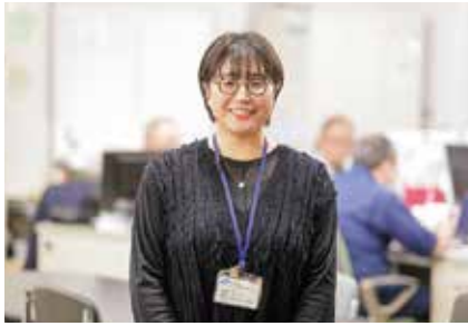
【入庁年】平成27年度 県北振興局商工水産部水産課 県北水産業普及指導センター