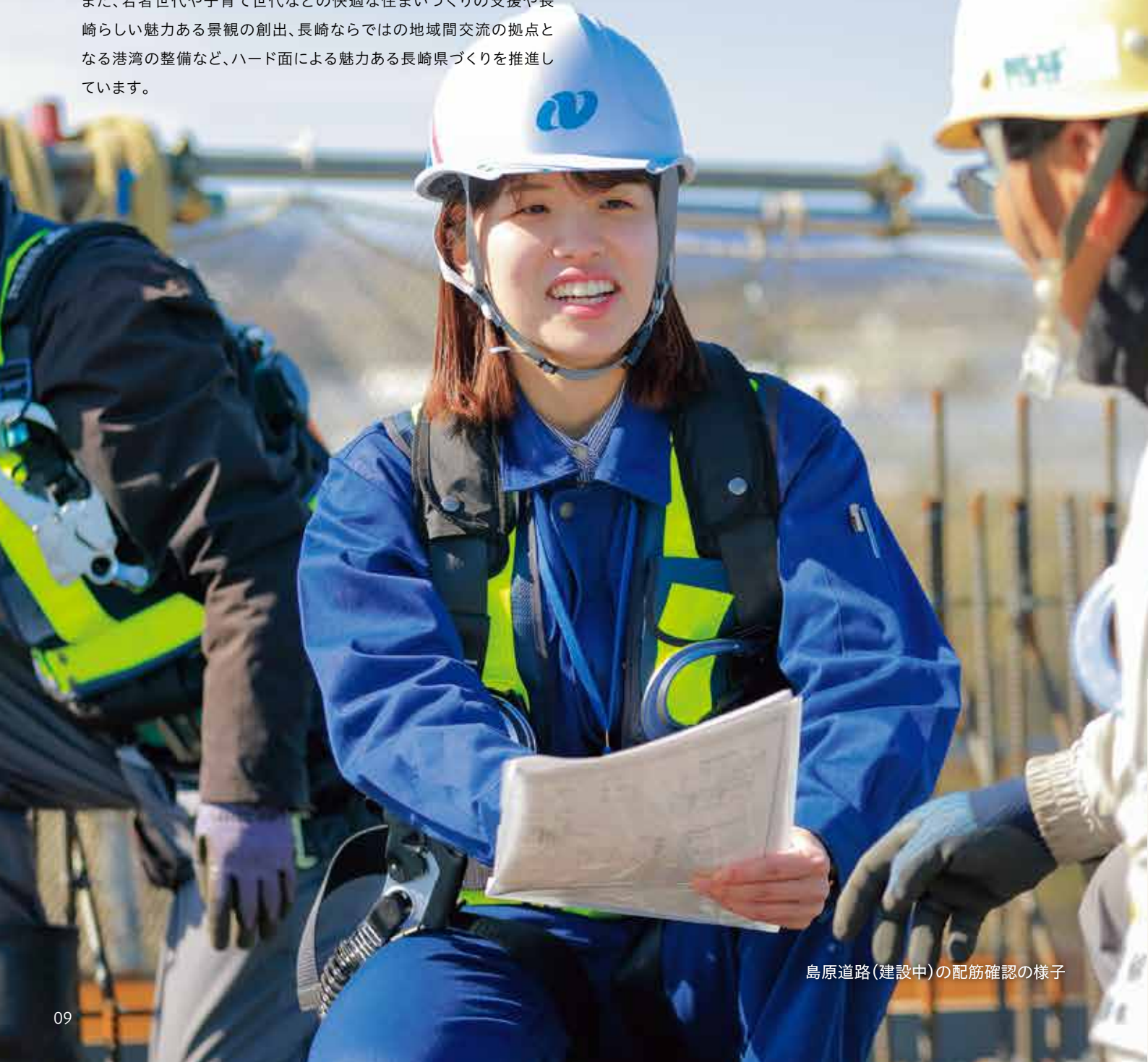
島原道路（建設中）の配筋確認の様子