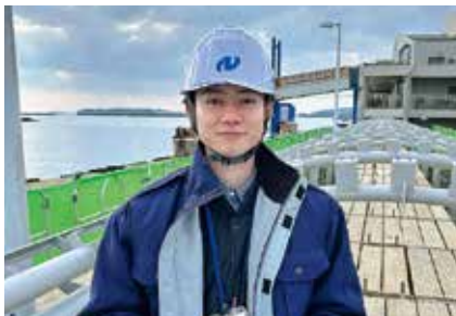
【入庁年】令和4年度 杵岐振興局建設部管理・用地課建築班